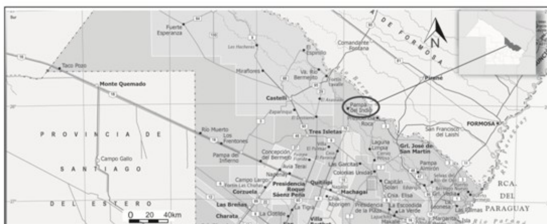
Figura 1. Ubicación de Pampa del Indio, provincia de Chaco (Argentina)