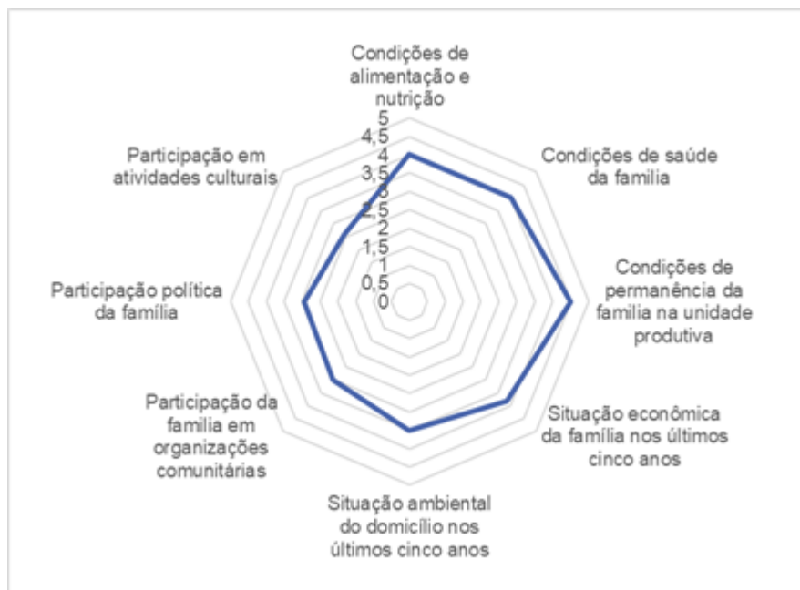
Figura 5 Efeitos do Desenvolvimento