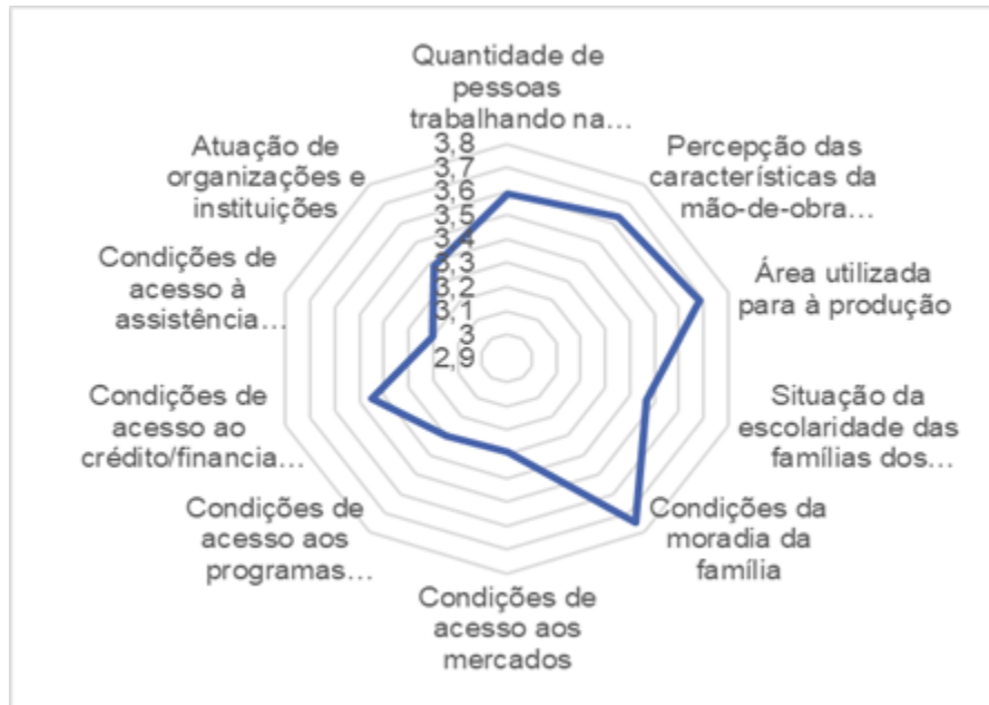
Figura 3 Fatores do Desenvolvimento

Logo, nos fatores de desenvolvimento, destaca-se a preocupação dos entrevistados com suas moradias, a satisfação em relação a situação da escolaridade das famílias e a questão do tamanho da família, que foi resolvido, naquilo que a literatura denomina de “realização da transição demográfica”. Todavia, questões ligadas ao real desenvolvimento, como os mercados e o crédito ainda são deficientes, mas existe boa perspectiva no que se refere ao processo de produção com base no trabalho familiar. Dessa forma, a média aritmética dessa instância é de 3,47, podendo ser considerado como de nível médio dentro da quadra do desenvolvimento das instâncias propostas em nossa metodologia.