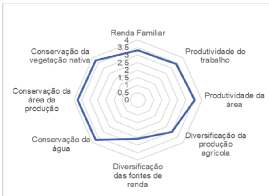
Figura 4 Características do Desenvolvimento

Destaca-se na Figura 4 a importância de elementos de conversão relacionadas a questão da conservação ambiental entre as características do desenvolvimento e um indicador surpreendente: a fragilidade da diversificação da renda , mostrando que a principal renda é extraída da unidade produtiva, apontando amplas possibilidades de desenvolvimento da agricultura familiar com tendência a diminuição da dependência dos programas sociais. Excetuando-se a importância social do PBF, universal na pesquisa realizada, o Benefício de Prestação Continuada praticamente não existe e o tamanho da família aponta essa questão.